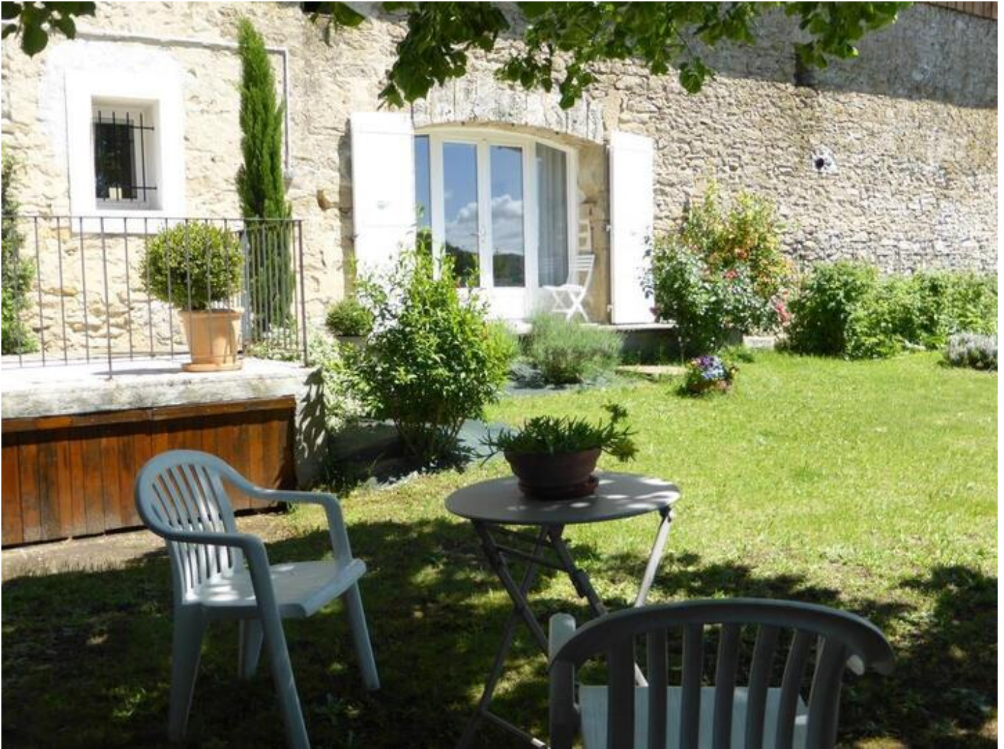
Le Studio des Tilleuls 38840 Saint-Lattier

Joli studio aménagé pour 2 personnes dans un bel environnement campagnard, sur le site d'une ancienne exploitation agricole. Grande pièce de vie lumineuse, cuisine intégrée toute équipée (Cuisinière mixte avec four électrique, micro-ondes, l.vaisselle, cafetière Senséo + cafetière à filtre...), Canapé-lit RAPIDO couchage 160 + possibilité d'un lit-enfant, s. d'eau-wc, lavabo, douche (l.linge), TV écran plat, wifi, terrasse et jardinet fleuri. En commun ping-pong, local vélos et motos, parking. A prox. St Antoine l'Abbaye, à Romans sur Isère Marques Avenue et le Musée de la chaussure, à prox. Jardin Ferroviaire, Grottes, Bateau à Roues, Miripili l'île aux Pirates, Sentiers balisés... Gîte mitoyen à la maison des propriétaires.