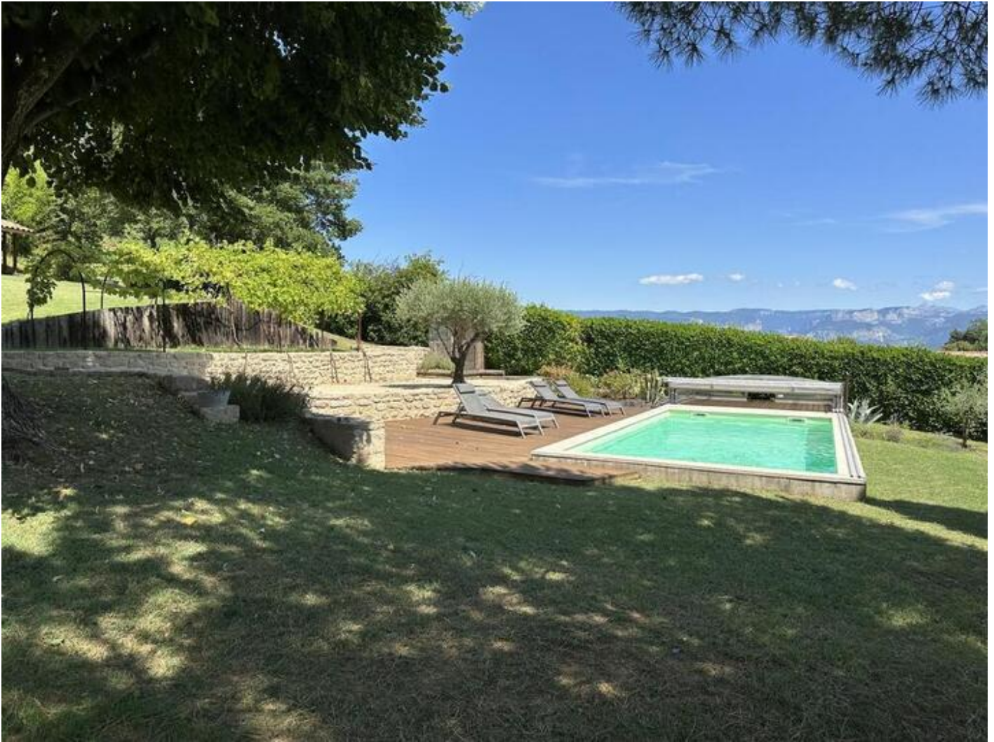
Gîte des Bardons 38840 Saint-Lattier

Gîte de caractère de plain-pied, aménagé avec des matériaux de qualité dans une belle bâtisse traditionnelle en pierres, situé aux portes du Vercors et de la Drôme avec vue sur les montagnes.