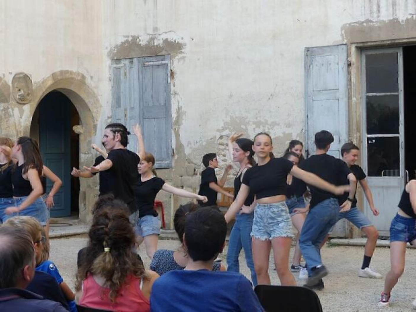
Spectacle chant et danse "Animalus Sapiens" 38840 Saint-Bonnet-de-Chavagne

"Animalus sapiens" Par les Jeunes de Piment Scène (Grenoble) : Loi du plus fort ou lutte pour l'égalité des droits, laquelle concerne le monde animal ou celui des hommes ? - 20 chanteur.euse.s/comédien.ne.s/danseur.euse.s de 18 à 25 ans