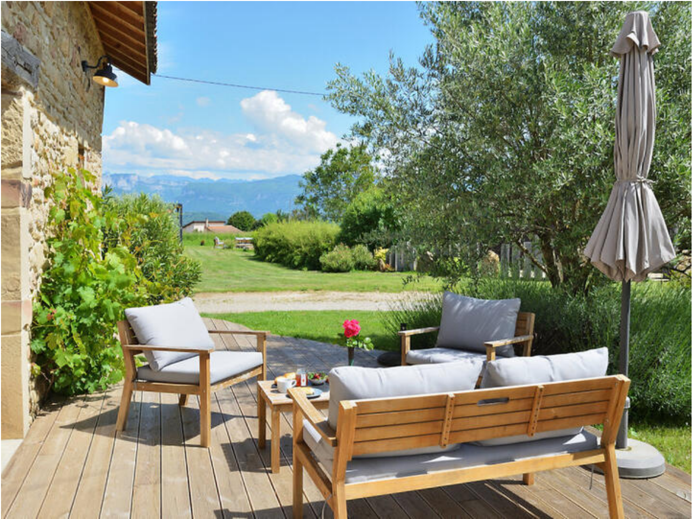
Les Granges du Fournel | Gîte Vercors 38840 Saint-Lattier

Vous disposerez d'un grand séjour avec cuisine équipée, coin salon et son poêle à bois, alcôve parentale (1 Lit 2 pers), s.d'eau-wc, un premier espace couchage supérieur avec 2 lits simples et un point d'eau, un deuxième espace couchage supérieur avec un lit 1 pers. TV écran plat,DVD, wifi, bibliothèque, terrasse bois avec transats & salon de jardin, parking.