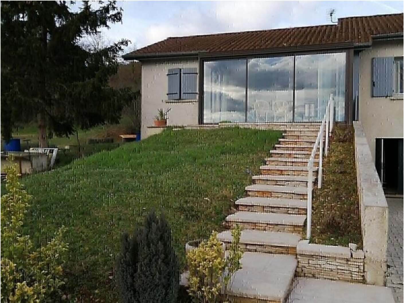
Gîte des Reguinelles 38840 Saint-Lattier

Idéal pour 1 ou 2 personnes. Nuitée, week-end, semaine, en gestion libre. Randonnées pédestres et visites sites touristiques. Proche du massif du Vercors, des Grands goulets, des stations de ski, et proche également des portes de Provence, vous découvrirez des paysages très variés.