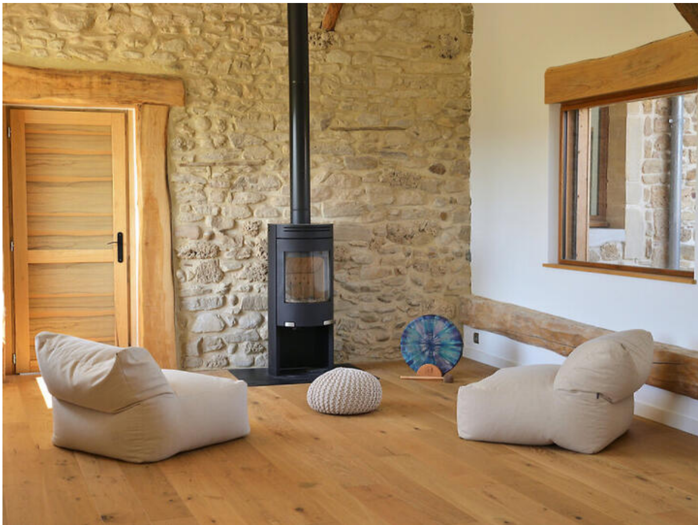
Les Granges du Fournel - Suite Meditation LODGE 38840 Saint-Lattier

Entre champs et montagne, Les Granges du Fournel s'ouvrent sur la majesté du Vercors. Ancienne bâtisse restaurée avec soin, elle marie la pierre, le bois et le fer dans un équilibre subtil. Tout ici respire la douceur : le pas feutré sur les planches anciennes, la lumière glissant sur les murs, le murmure du vent dans le grand tilleul vieux de quatre cents ans.