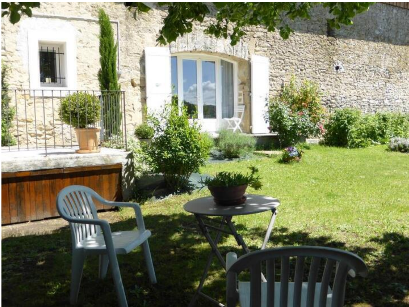
Le Studio des Tilleuls 38840 Saint-Lattier

Joli studio aménagé pour 2 personnes dans un bel environnement campagnard, sur le site d'une ancienne exploitation agricole. Grande pièce de vie lumineuse, cuisine intégrée toute équipée (Cuisinière mixte avec four électrique, micro-ondes, l.vaisselle, cafetière Senséo + cafetière à filtre...), Canapé-lit RAPIDO couchage 160 + possibilité d'un lit-enfant, s. d'eau-wc, lavabo, douche (l.linge), TV écran plat, wifi, terrasse et jardinet fleuri. En commun ping-pong, local vélos et motos, parking. A prox. St Antoine l'Abbaye, à Romans sur Isère Marques Avenue et le Musée de la chaussure, à prox. Jardin Ferroviaire, Grottes, Bateau à Roues, Miripili l'île aux Pirates, Sentiers balisés... Gîte mitoyen à la maison des propriétaires.