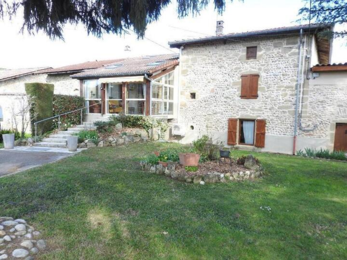
Gîte de la Pierre Verte 38840 Saint-Lattier