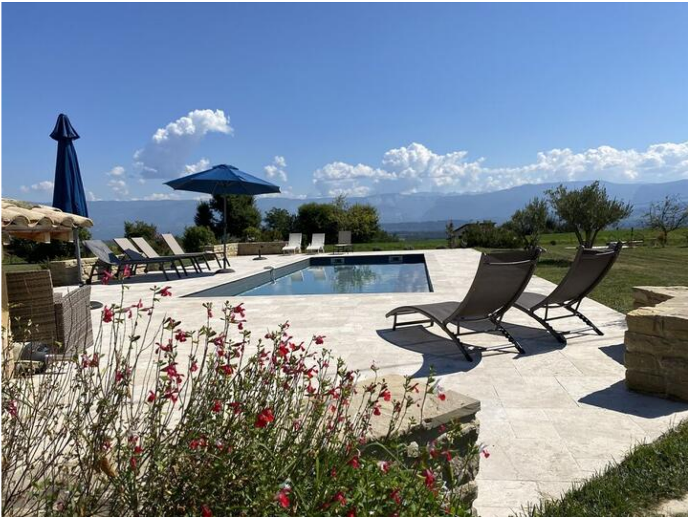
Les Granges du Fournel | Gîte du vieux Tilleul 38840 Saint-Lattier

Situé au premier étage d'une vieille grange, le gîte du Vieux Tilleul est comme une vigie sur la campagne environnante et le tilleul 4 fois centenaire. Vous entrez dans un espace où l'essentiel reprend sa place. Les journées s'égrènent au rythme du soleil, les soirées s'illuminent d'un ciel vaste et pur. Être là, ensemble, écouter le silence, sentir la beauté des choses simples. Ici, on vient se reconnecter à Soi, à l'autre, à la nature. Et l'on repart apaisé, le souffle et l'élan retrouvés.