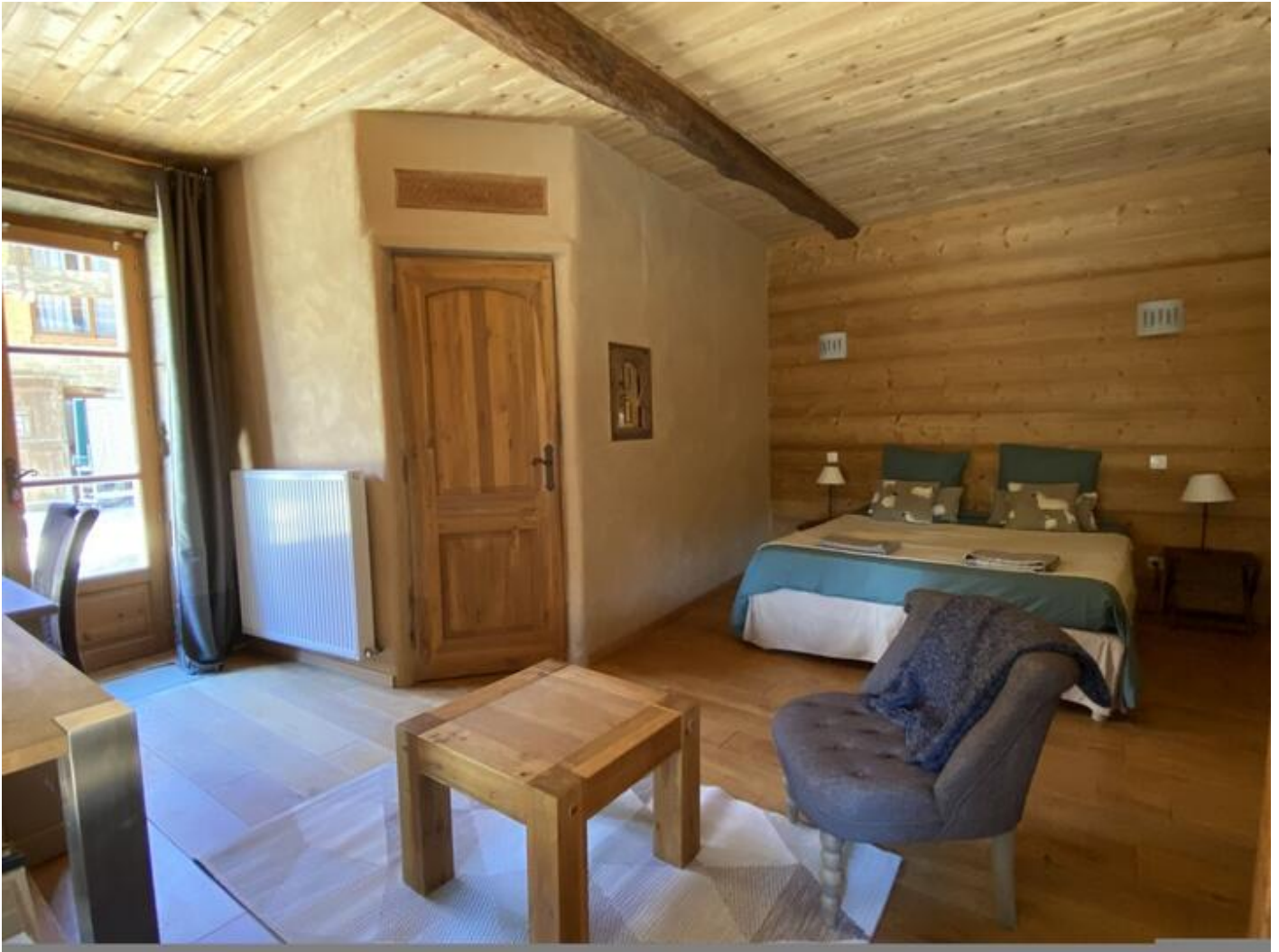
Les Granges du Fournel 38840 Saint-Lattier

Découvrez une belle maison traditionnelle en pierres située entre Drôme et Isère, face au massif du Vercors. Vous disposerez d'une grande chambre en Rez de chaussée. Les petits déjeuners seront pris selon la saison en terrasse face au Vercors ou en chambre. Vous pourrez facilement partir en escapade dans la drôme des collines, randonner dans le Vercors, découvrir les produits du terroir (Ravioles, Saint-Marcellin, Croze Hermitage, AOC noix de Grenoble...) Nous avons beaucoup d'itinéraires à vous proposer! A proximité nous vous proposons également 2 Gîtes pour 4 personnes . Nous pouvons vous proposer également des cours de Yoga en salle ou au bord de la piscine, Méditation, Shiatsu....N'hésitez pas à réserver. Anes, poney, cheval et Samoyède sont nos hôtes permanents.