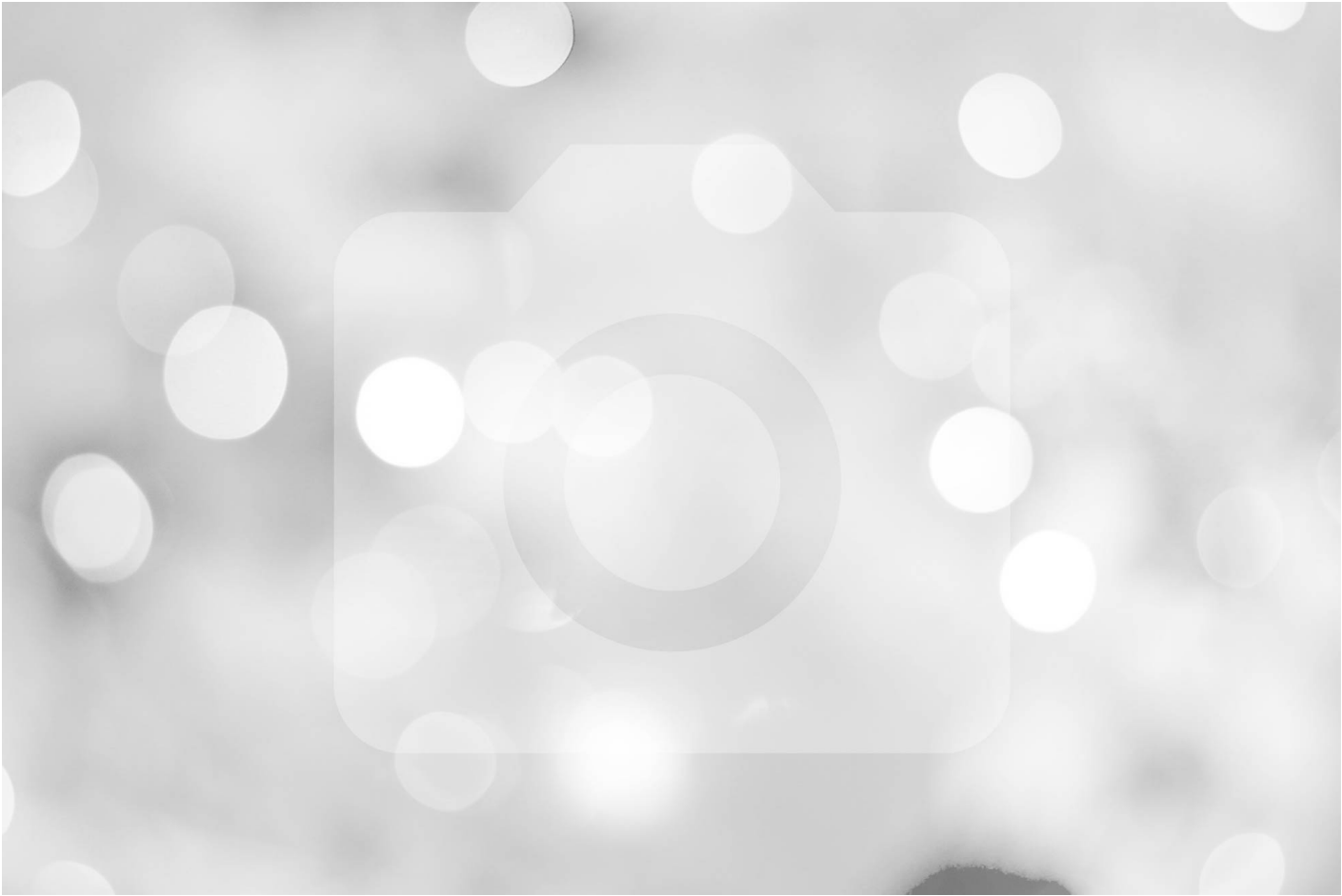
Le Jardin de la Baudière 38840 Saint-Lattier