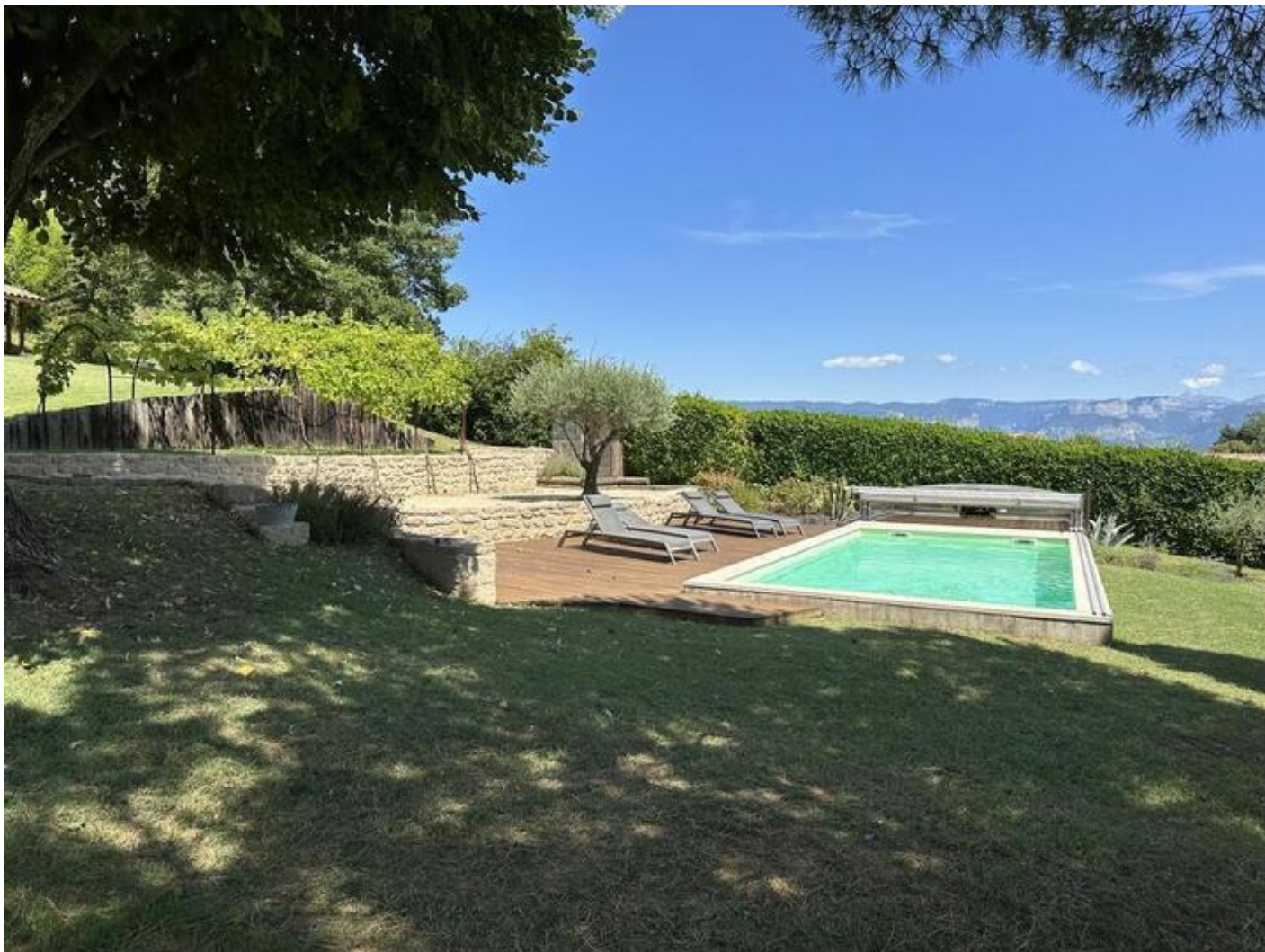
Gîte des Bardons 38840 Saint-Lattier

Gîte de caractère de plain-pied, aménagé avec des matériaux de qualité dans une belle bâtisse traditionnelle en pierres, situé aux portes du Vercors et de la Drôme avec vue sur les montagnes.