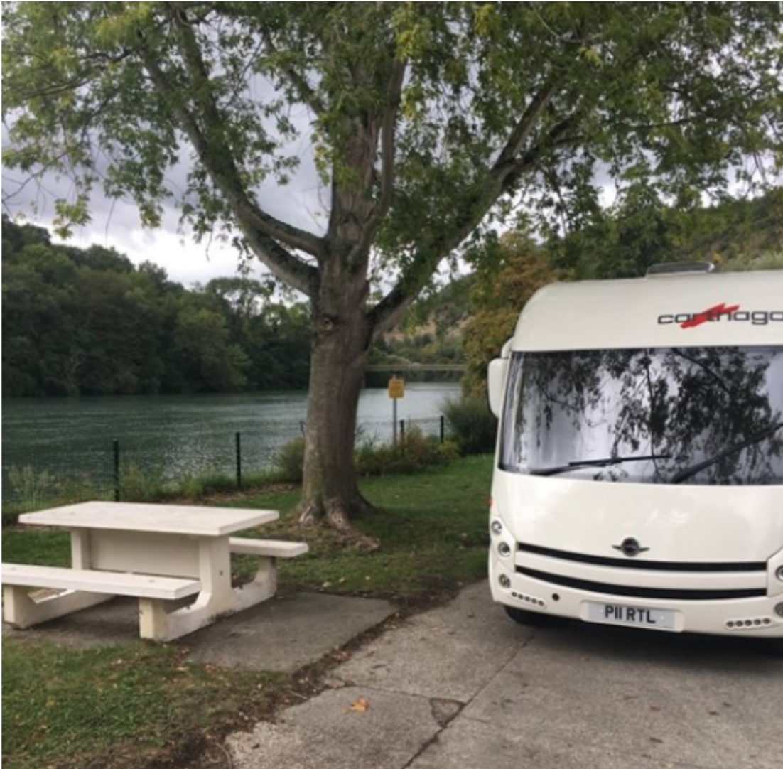
Aire de camping-cars aux Fauries 38840 Saint-Lattier