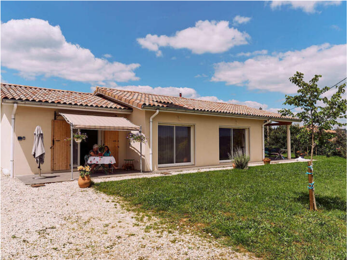
La Maison Cavanha 38840 Saint-Lattier

Le studio est équipée d'une climatisation réversible. La kitchenette comporte une cuisinière 3 plaques à induction et un four électrique, un four à micro-onde, un réfrigérateur top, un lave-vaisselle 6 couverts, 1 machine à café Nespresso, 1 appareil à raclette 2 personnes ainsi que toute la vaisselle nécessaire. Dans la salle de bains, il y a une douche, un double lavabo et un lave-linge. Sur la terrasse bien ombragée, il y a un barbecue électrique.