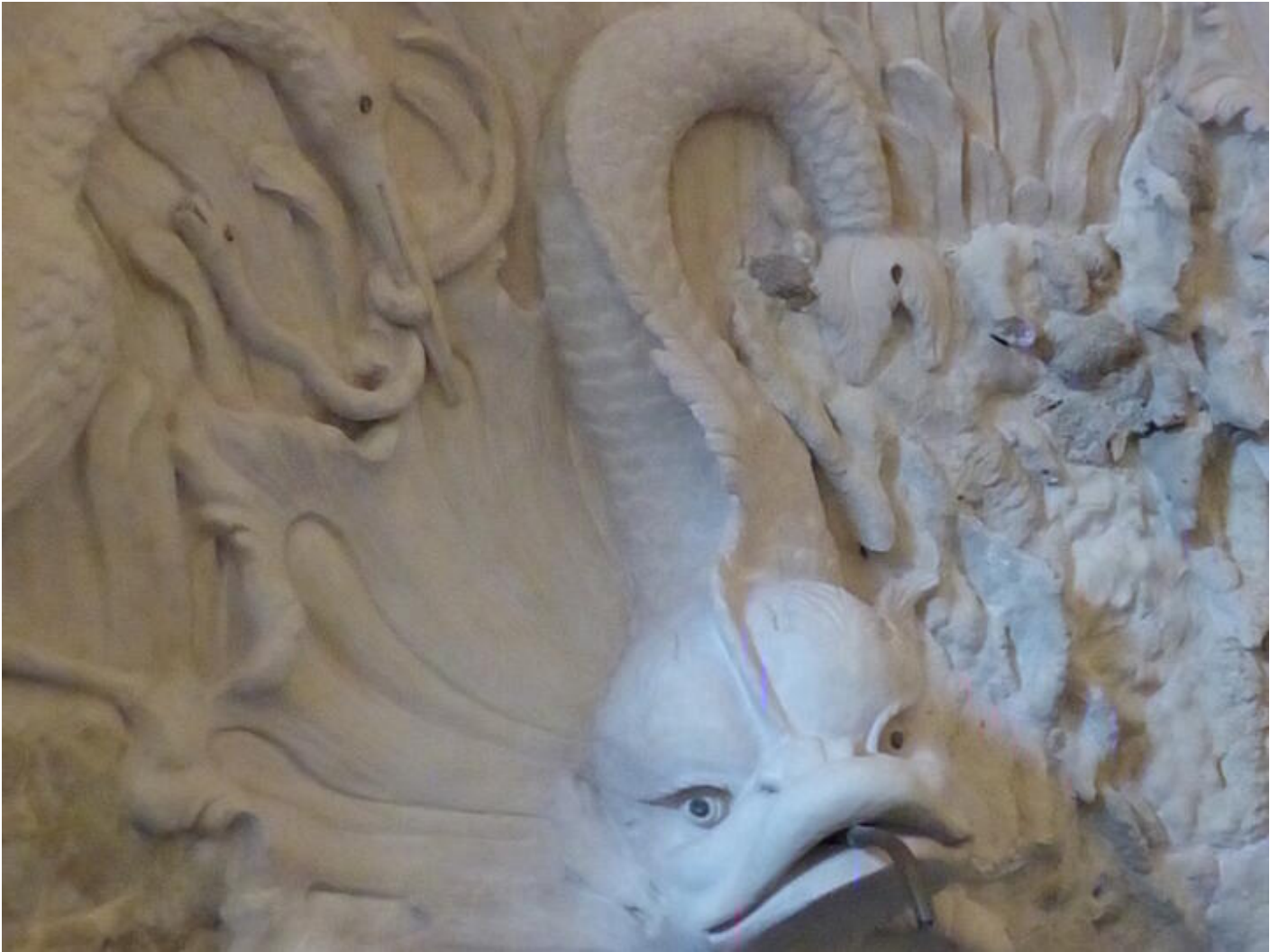
Visite guidée Saint-Antoine au fil du temps - Le temps du renouveau : art et collections 38160 Saint-Antoine-l'Abbaye

Visite permettant de découvrir des espaces qui ne sont pas ouverts au public.